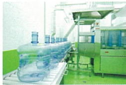
優良工場に認定された清潔な工場、安全でおいしいお水を日々安定生産しています。