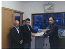
東日本大震災の折も生産を途切れさせず、水戸市にボトルを無償提供しました。

近年、医院の待合室やスタッフ休憩室などでの利用が急増しているウォーターサーバー&宅配水。安全でおいしい水がサッと飲めることから、健康管理に敏感な患者様に大好評。ニーズに後押しされる形で、各医院が続々と導入を決めています。また、万が一の災害時に備蓄水としての活躍が期待できるため、導入を決意された医院様も多数。アクアクララはこうした高いニーズにおこたえできる、頼れる水ブランドです。