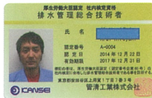
厚生労働省認定の社内検定