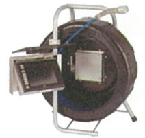
テレビカメラシステム