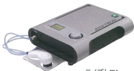
ライズトロン 定価 ¥ 1,600,000