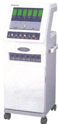
スーパーテクトロン HX606 定価 ¥ 3,950,000