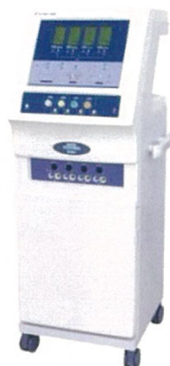
スーパーテクトロン HX604 定価 ¥ 3,500,000