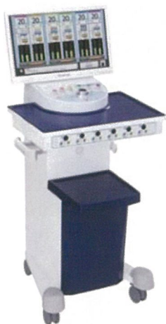
NEOテクトロン ONE-P6 定価 ¥ 4,000,000