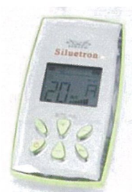
SERAPM シルエット 定価 ¥ 128,000