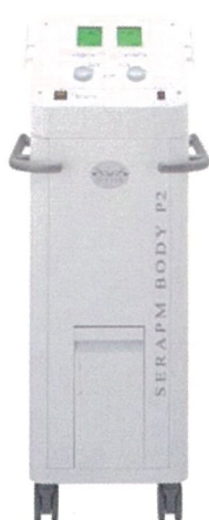
SERAPM BODY P2 定価 ¥ 2,480,000