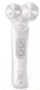
SERAPM Rcube 定価 ¥ 168,000