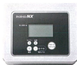
家庭用超短波治療器 ライズトロンNX 定価 ¥ 198,000