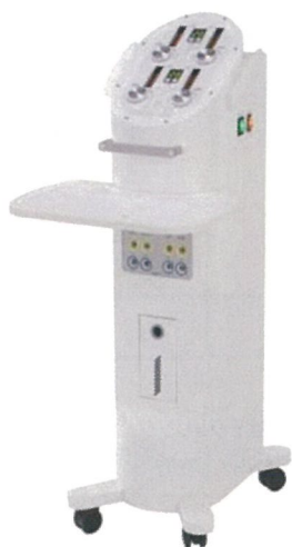
SERAPM BODY P4 定価 ¥ 2,680,000