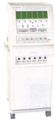
エグゼクトロン 606 定価 ¥ 3,950,000