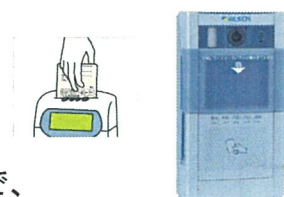
カメラ付き 遠隔操作器