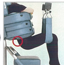
牽引しない牽引(免荷)