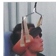
顎にかけない特許ハーネス