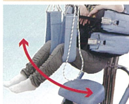
腰椎・骨盤の回旋運動