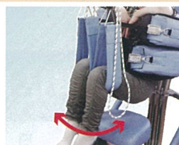
膝関節の屈曲・伸展