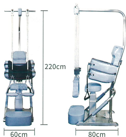
従来のベッド型牽引機と比較して、1/3のスペース(新聞紙1枚分)に設置可能