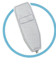
2つのボタンで簡単操作