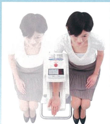
左右どちらの腕でもスムーズに