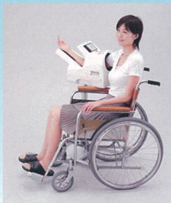
車いすのまま計測可能